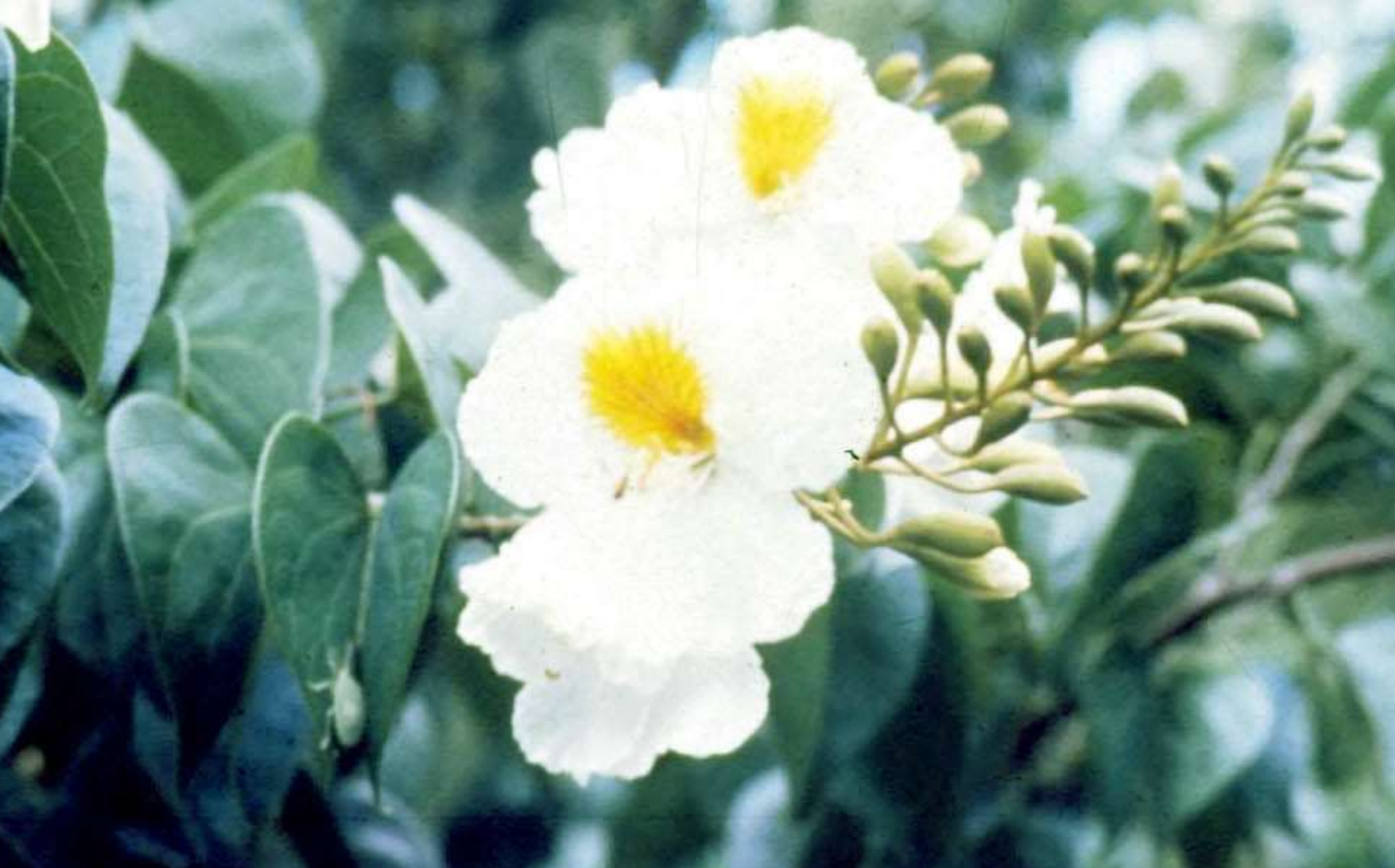
Pata de vaca anã