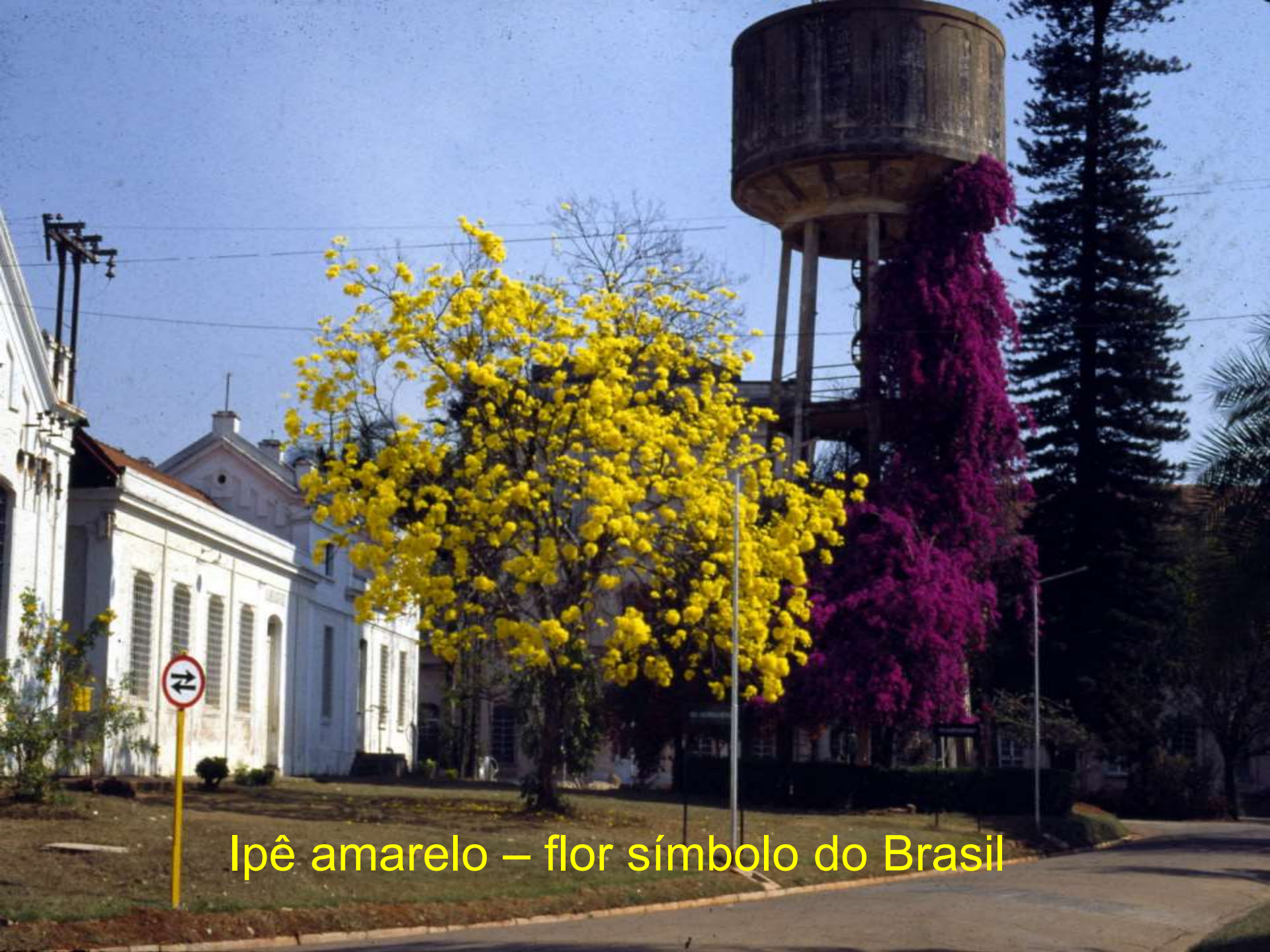
Ipê amarelo – flor símbolo do Brasil