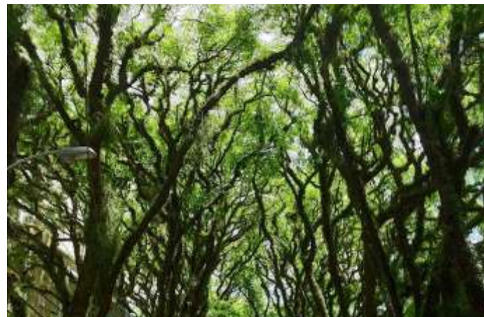
Porto Alegre, Brasil