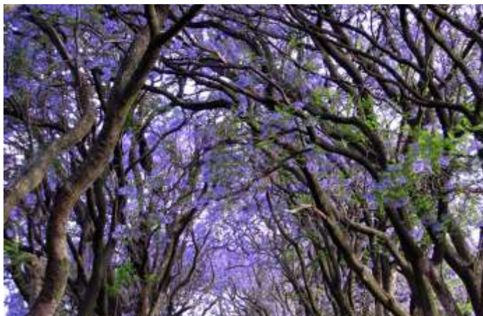
Cullinan, África do Sul