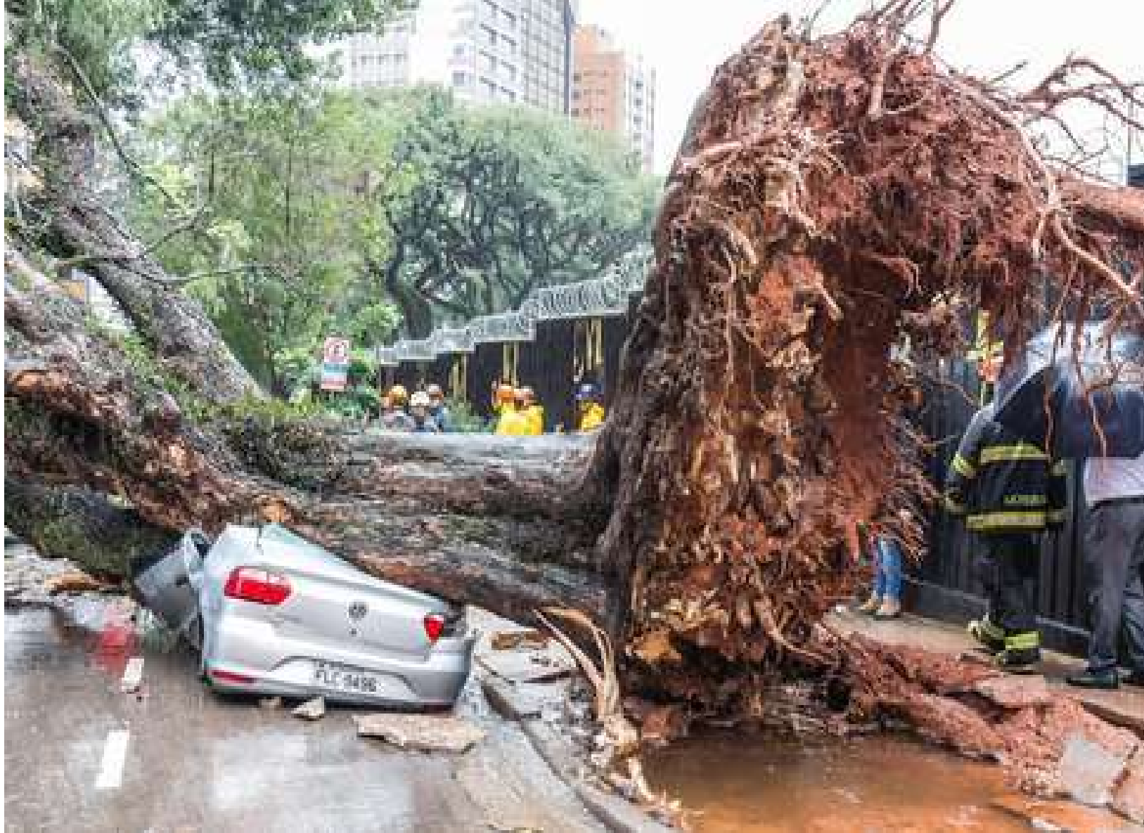
Queda de árvore de grande porte na rua Itapeva, no bairro da Bela Vista (19-05-17)