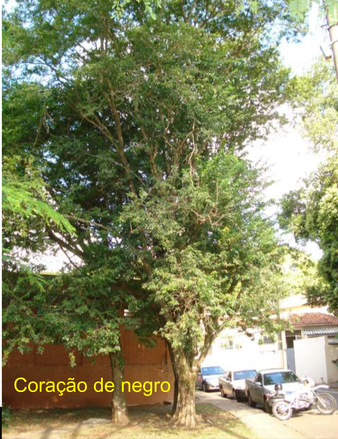
Coração de negro