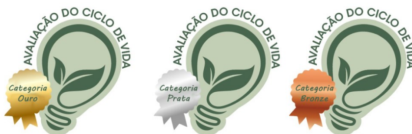
Figura 1 - Selos de qualidade ACV categorizados como ouro, prata e bronze.

Para fins de exemplificação está apresentada na Figura 1, uma sugestão de selo que pode ser aplicado na cadeia produtiva de produtos para iluminação, conforme seu nível de aderência às chamadas PCR: Regras de Categorias de Produtos (vide ABNT NBR ISO 14025:2015). A categoria ouro seria destinada a luminárias que possuem total rastreabilidade, desde ao uso dos materiais necessários a produção, até as políticas de reciclagem e reaproveitamento empregados pela empresa. A categoria prata seria destinada a luminárias que possuem total rastreabilidade, desde ao uso dos materiais necessários a produção, até as políticas de descarte correto. E por fim a categoria bronze a luminárias que possuem total rastreabilidade uso dos materiais necessários a produção.