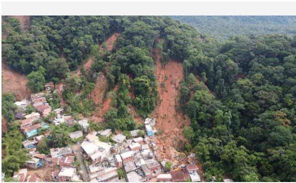
São Sebastião – SP, 2023