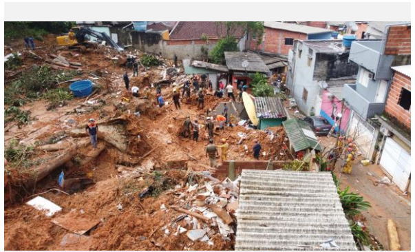
São Sebastião – SP, 2023