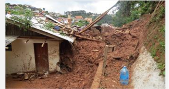
Campos do Jordão – SP, 2023

Alta suscetibilidade a movimentos de massa