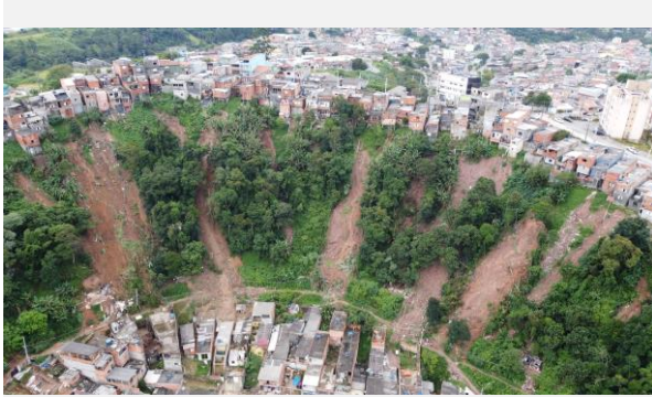
Ferraz de Vasconcelos – SP, 2023